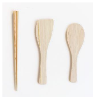
檜の間伐材を使用したキッチン用具

Standard Products では、国産木材や国内林業で余剰とされる間伐材を活用することを通して、森林保全や林業の安定的な成長への貢献を目指しています。開発、生産にあたっては、国内メーカーや各地の林業との協働を通じた地域産業への寄与にも取り組んでいるほか、環境や地域社会に配慮した製品を通じ、今後も持続可能で豊かな社会の実現に積極的に貢献してまいります。