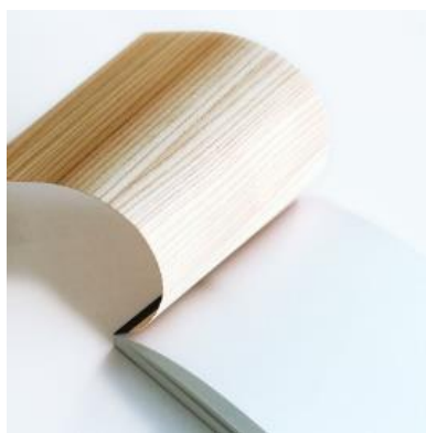
木材を表紙に使用したメモ帳