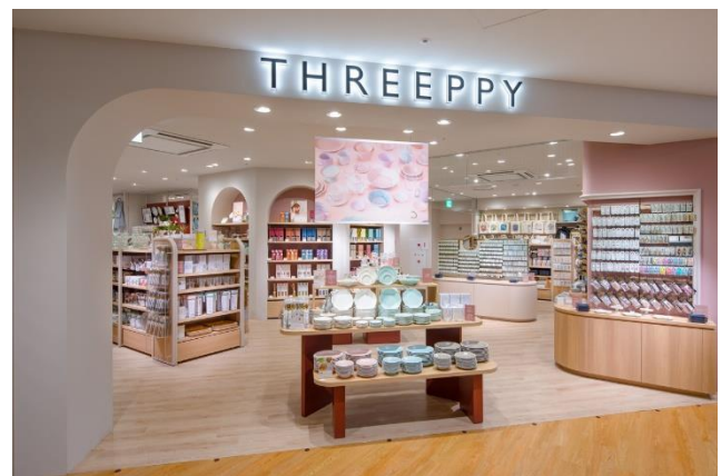
店舗イメージ（写真は東京都中央区・マロニエゲート銀座店）