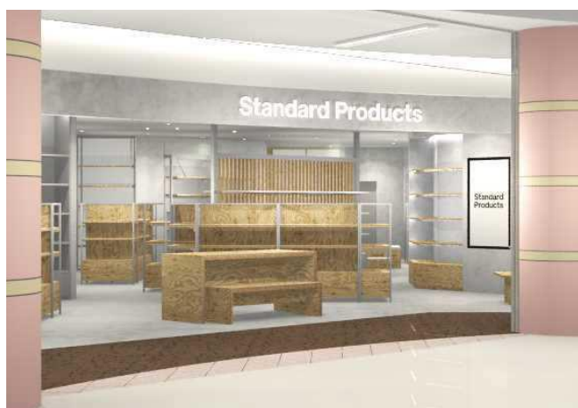
Standard Products ゆめタウンシティモール店 店舗イメージ

Standard Products ゆめタウンシティモール店、Standard Products ゆめタウンはません店は、いずれも郊外型ショッピングモール内に店舗し、様々な年齢層のお客様にお買い物を楽しんでいただけます。環境に配慮した間伐材を使った商品や、ピュアエッセンシャルオイルなど、生活に取り入れやすいベーシックで洗練されたデザインの日用品を扱います。商品は約2,000品を取り揃え、今後も毎月約100品を展開予定です。