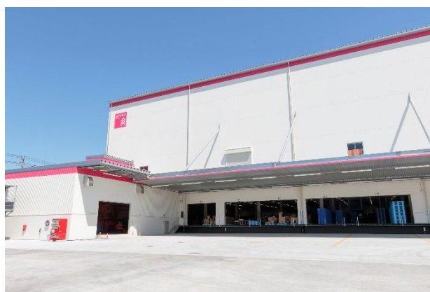
「大創産業 神奈川 RDC」外観