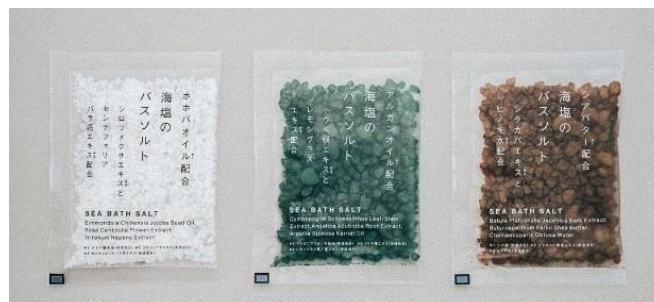
左からシロツメクサの香り、トウキの香り、シラカバの香り

先着 900 名様へ海塩(かいえん)のバスソルトのミニサイズをプレゼント。国産の植物性エキスを配合し、良質な美容成分をブレンドした入浴剤を、3 つの香りの中からランダムでおひとつお渡します。