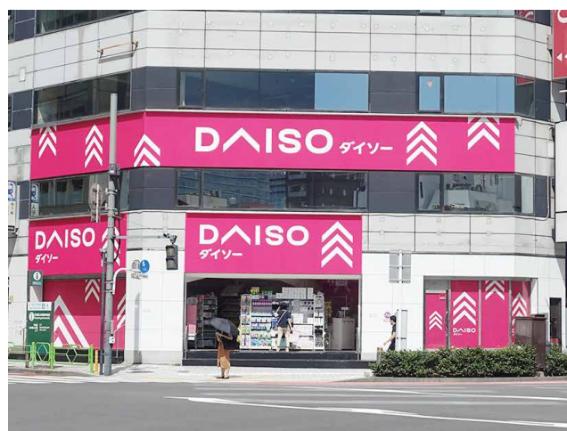
小型店 路面店 人形町駅店 約55坪(約181.8㎡)