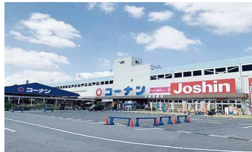
コーナン平野瓜破店 約160坪(約528.9㎡)