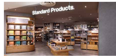
Standard Products 約108坪(約357㎡)