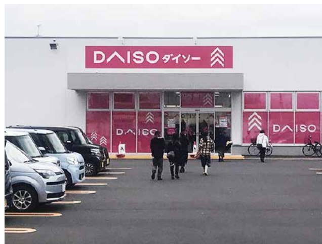
標準店 旭川パワーズ店 約208坪(約687㎡)