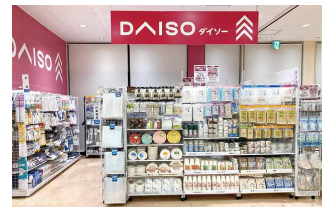
カスミ日立豊浦店 約14坪(約46.3㎡)