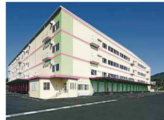
広島RDC 12,500坪 (41,322㎡)