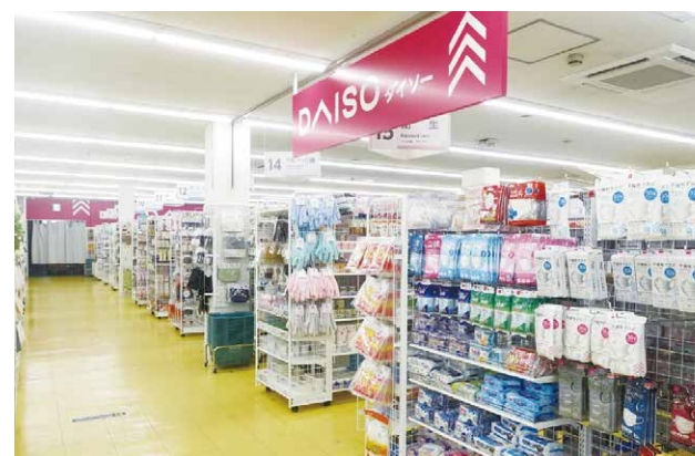
コモディイイダ三鷹店 約94坪(約310.7㎡)

スーパーマーケットなどの店舗の一角にDAISOの売場スペースを作り、食品などのお買い上げ商品と一緒にスーパーマーケットのレジにて会計していただく形態です。