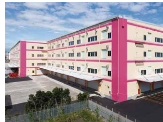
千葉RDC 31,000坪 (102,479㎡)