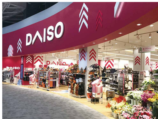
標準店 イオンモール高岡西館店 約237坪(約783㎡)