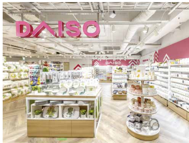
大型店 【旗艦店】大阪梅田店 約738坪(約2,440㎡)