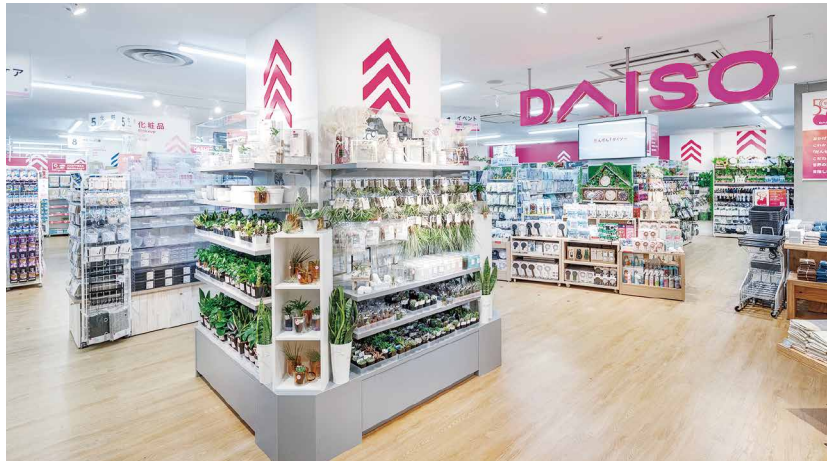
【グローバル旗艦店】マロニエゲート銀座店 497坪(約1,645㎡) DAISO 約316坪(約1,044㎡)