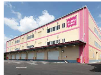
名古屋RDC 22,000坪 (72,727㎡)