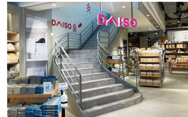
京都四条通り店 215坪(約710.7㎡)