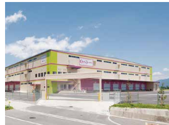
九州RDC 29,300坪 (96,770㎡)