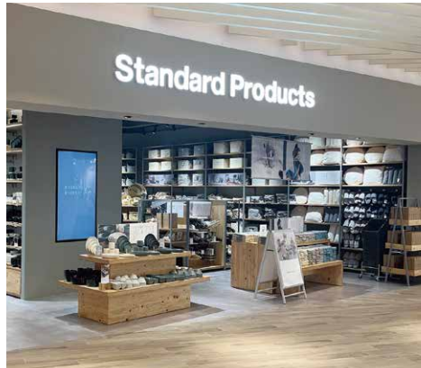
Standard Products 62.5坪（約206㎡）