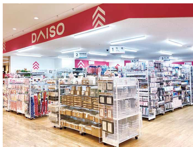
小型店 駅ナカ ルミネ立川店 約40.4坪(約133.6㎡)