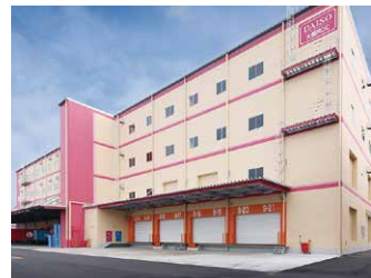
大阪RDC 21,000坪 (69,421㎡)