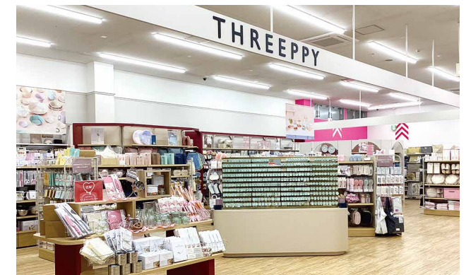
DAISO 約249.7坪(約824㎡) ・ THREEPPY 約31.6坪(約104㎡)