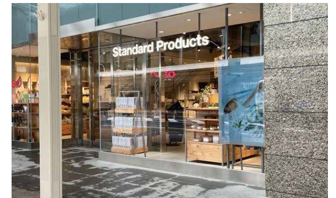
DAISO 約106坪(約350.4㎡) ・ Standard Products 約109坪(約360.3㎡)