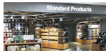
Standard Products 約113坪(約375㎡)