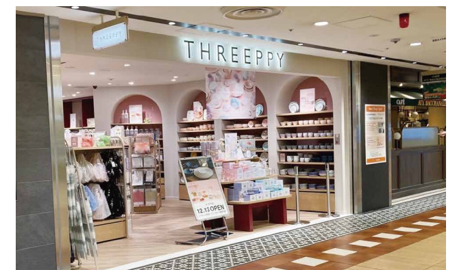
Standard Products 約78.9坪(約260.8㎡) ・ THREEPPY 約35坪(約115.7㎡)