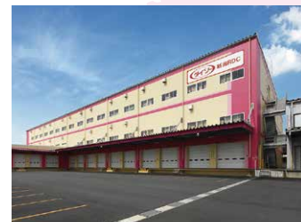
新潟RDC 12,500坪 (41,322㎡)