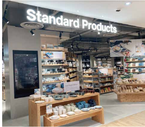
Standard Products 76坪（約251㎡）