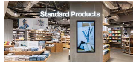
Standard Products 約130坪(約432㎡)