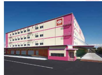
埼玉RDC 18,000坪 (59,504㎡)