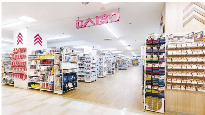
【旗艦店】池袋東武店 713.6坪(約2,359㎡) DAISO 約556坪(約1,838㎡)