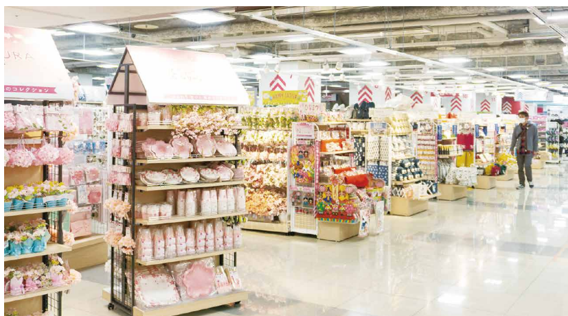
【旗艦店】博多バスターミナル店 922坪(約3,048㎡) DAISO 約771坪(約2,548㎡)