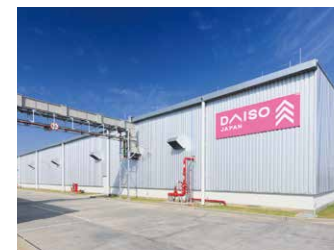
タイ倉庫兼工場11,704坪 (38,692㎡)