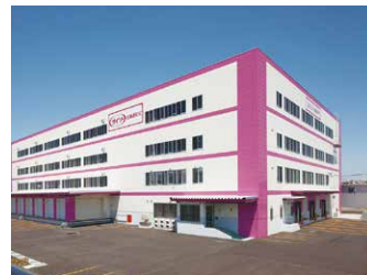
北海道RDC 10,400坪 (34,380㎡)