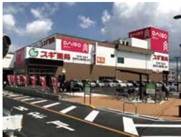
大型店 ロードサイド 豊橋下地店 約488坪(約1,646㎡)