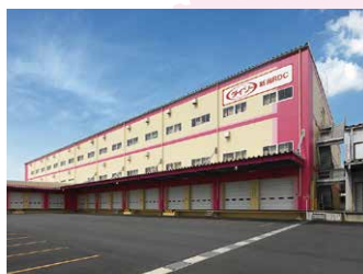
新潟 RDC 12,500坪 (41,322㎡)