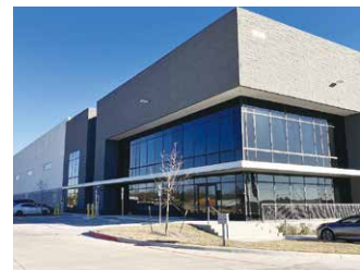
アメリカ(デント)倉庫 5,902坪 (19,511㎡)