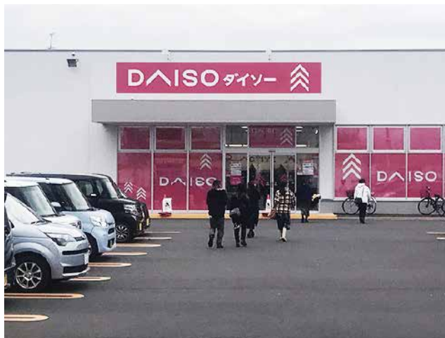
標準店 旭川パワーズ店 約208坪(約687㎡)