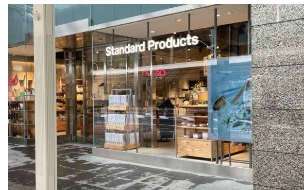
DAISO 約106坪(約350.4㎡)・Standard Products 約109坪(約360.3㎡)