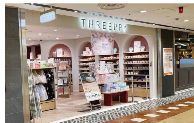
Standard Products 約78.9坪(約260.8㎡)・THREEPPY 約35坪(約115.7㎡)