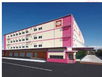
埼玉 RDC 18,000坪 (59,504㎡)