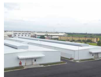
ベトナム倉庫兼工場 6,000坪 (19,835㎡)