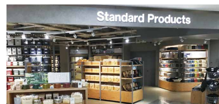
Standard Products 約113坪(約375㎡)