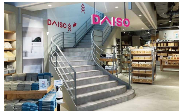
京都四条通り店 215坪(約710.7㎡)