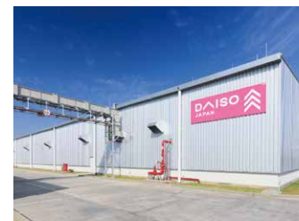
タイ倉庫兼工場 11,704坪 (38,692㎡)