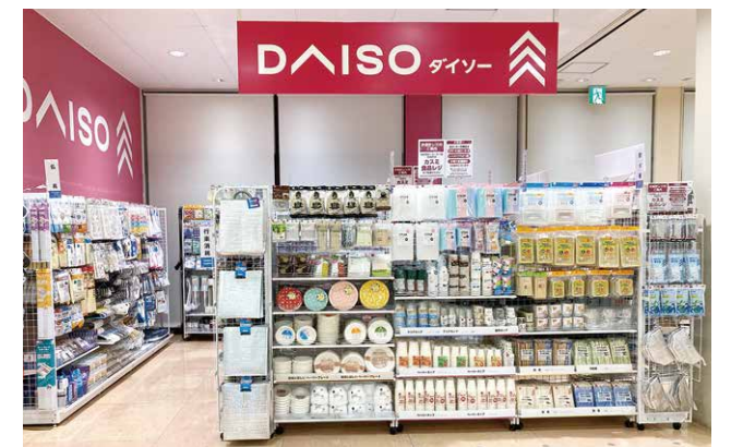
カスミ日立豊浦店 約14坪(約46.3㎡)