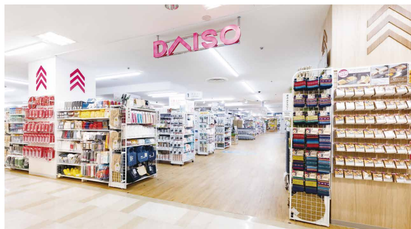
【旗艦店】池袋東武店 713.6坪(約2,359㎡)