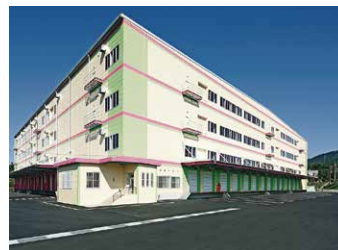
広島 RDC 12,500坪 (41,322㎡)