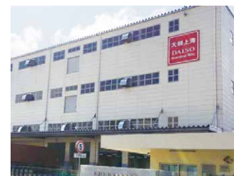
上海倉庫 10,018坪 (33,117㎡)