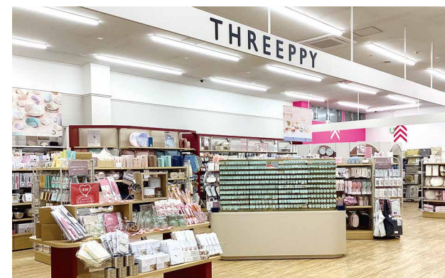
DAISO 約249.7坪(約824㎡)・THREEPPY 約31.6坪(約104㎡)