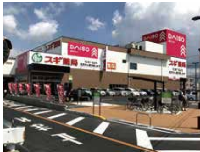
大型店 ロードサイド 豊橋下地店 約488坪(約1,646㎡)