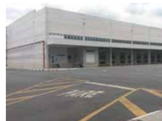
ブラジル倉庫 3,630坪 (12,000㎡)