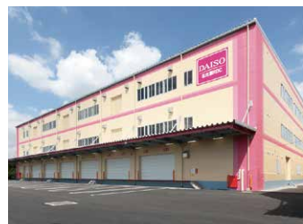
名古屋 RDC 22,000坪 (72,727㎡)