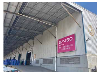
南沙倉庫 3,940坪 (13,000㎡)