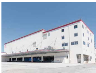
神奈川 RDC 16,200坪 (53,460㎡)