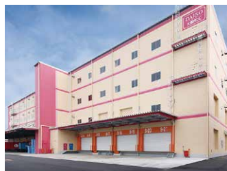
大阪 RDC 21,000坪 (69,421㎡)