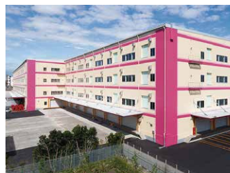
千葉 RDC 31,000坪 (102,479㎡)