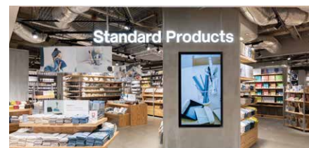
Standard Products 約130坪(約432㎡)