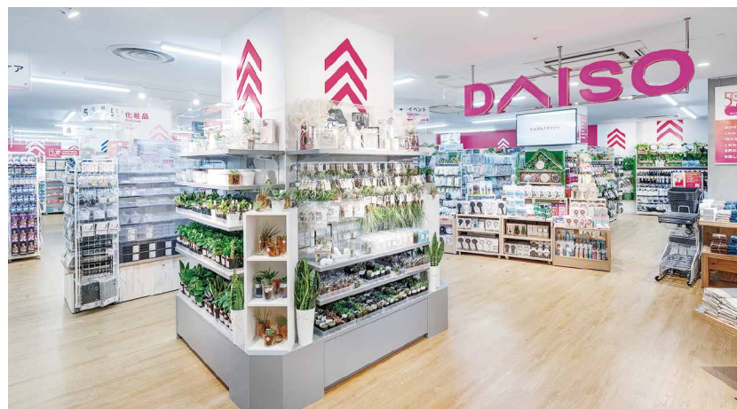
【グローバル旗艦店】マロニエゲート銀座店 497坪(約1,645㎡) DAISO 約316坪(約1,044㎡)