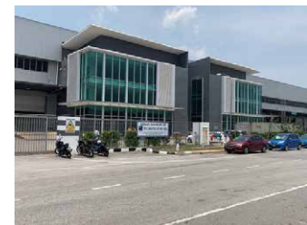
マレーシア倉庫 7,365坪 (24,347㎡)