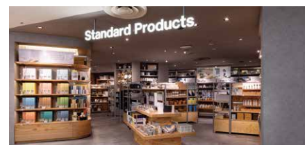
Standard Products 約108坪(約357㎡)