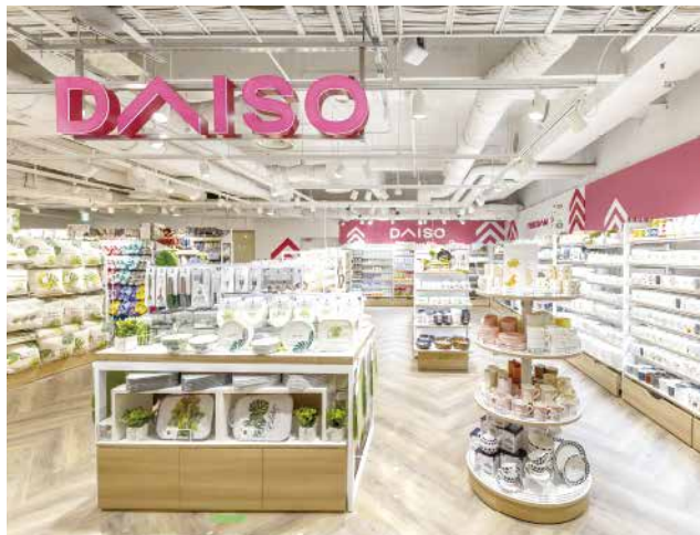
大型店 【旗艦店】大阪梅田店 約738坪(約2,440㎡)