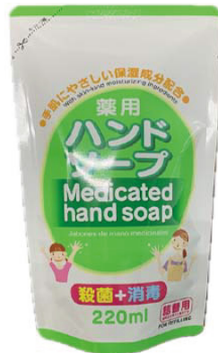
商品名：詰替用 ダイソー薬用ハンドソープ JANコード：4984343516991