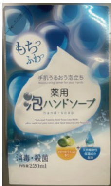
商品名：薬用泡ハンドソープ ライム 詰替用 JANコード：4549131367690