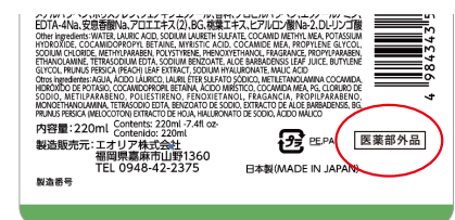
詰替用 ダイソー薬用ハンドソープ

大変お手数をお掛けいたしますが、対象商品をお持ちのお客様は、下記お問い合わせ先までご連絡いただきますようお願い申し上げます。商品を確認後、交換もしくはご返金にて対応させていただきます。なお、ご不明な点がございましたら、下記窓口までお問い合わせください。