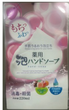
商品名：薬用泡ハンドソープ フルーツ 詰替用 JANコード：4549131367706