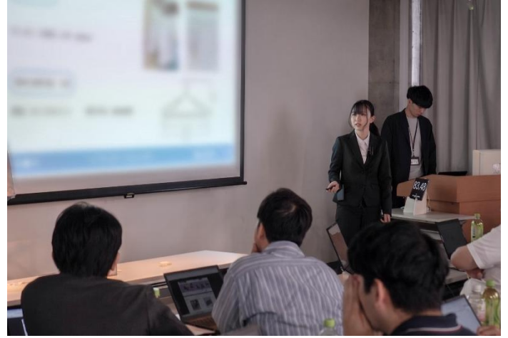
昨年8月に、京都芸術大学で行われた最終プレゼンテーションで発表する学生

本プロジェクトは、学生の斬新な発想と大創産業の豊かな商品開発ノウハウの融合を目指す機会と、文化芸術分野における人材育成やコンテンツ産業の強化を目的に、学生が企業と接点を持ち、企画から商品化までを担う“社会実装型の学び”の実践として位置づけられています。2017年、2021年、2023年に続き、今回が4回目の開催で、「日常の不便を解消する機能性のある新商品」をテーマに、2・3年生16人がアイデアを提案し、代表取締役社長、商品本部長をはじめ、第一線で活躍するバイヤー総勢17人が商品化に向けて審査を行いました。